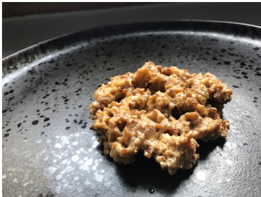
Texture « steak à point »