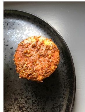
Texture « steak croustillant »