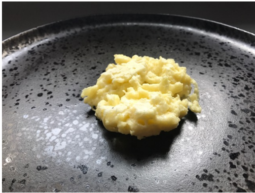
Texture « steak saignant »