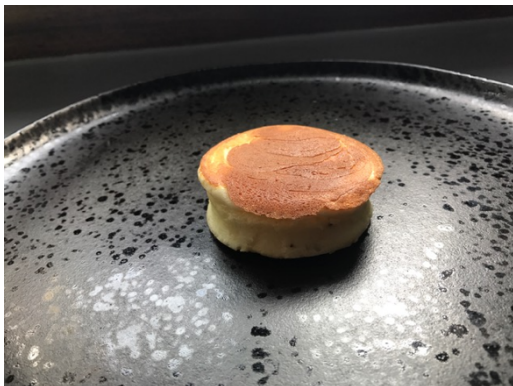
Texture « steak bien cuit »